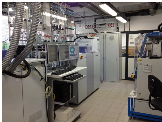
Figure 1 : Quelques équipements haut-débit de la plateforme REALCAT

Ce projet IMPACT est lié à l'Équipement d'Excellence REALCAT (plateforme intégrée Appliquée au criblage haut débit de Catalyseurs pour les bioraffineries) installée dans les murs de Centrale Lille (Figure 1). Cette plateforme permet la mise au point des procédés catalytiques qui seront utilisés dans l'industrie chimique de demain dans le contexte du déploiement de la bioéconomie. Ces procédés devront donc s'affranchir de leur trop forte dépendance aux ressources fossiles qui sont, on le sait, disponibles en quantité limitée et dont l'usage impacte très fortement notre environnement. Ces recherches comportent trois étapes : la synthèse chimique de nouveaux catalyseurs, leur analyse (leur caractérisation dans le jargon des chimistes) et, enfin, la mesure de leurs performances pour une réaction d'intérêt donnée. Ce processus de développement est généralement long et coûteux si on utilise l'approche expérimentale « essai-erreur » traditionnelle.